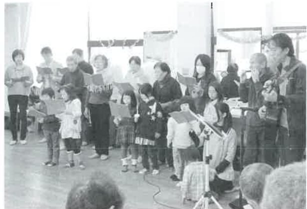
加茂福音キリスト教会