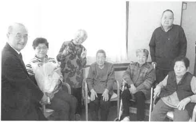
デイサービスセンター康養園にて

3月初め、民生委員の協力により、支援が必要な一人暮らし高齢者や重度障がい者のお宅を訪問、孤立感の解消や見守り支援を兼ねてフリージアの花をお届けしました。また、町内の高齢者・障がい者施設には社協会長が訪問し、花東をお届けしました。利用者の皆さんから一足早い春を感じていただきました。