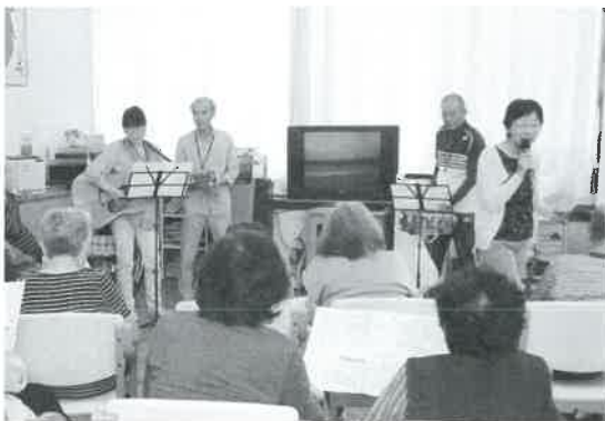
民生委員第三部会