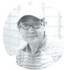
美術指導 てつ安中様