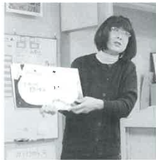
読み聞かせサニープレイス