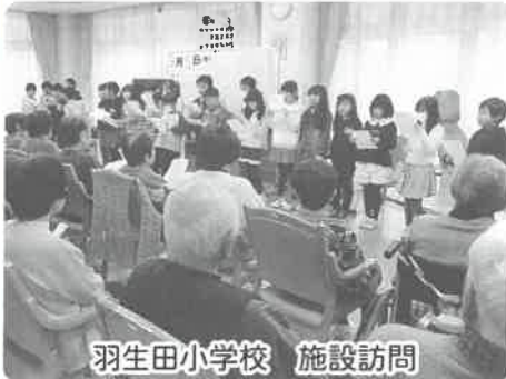
羽生田小学校 施設訪問