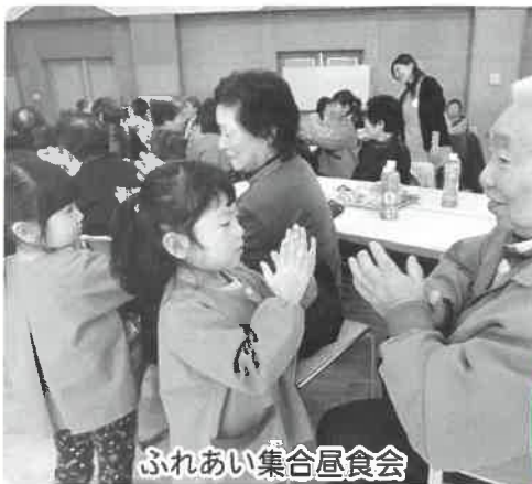
ふれあい集合昼食会