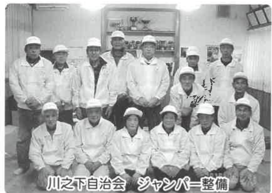
川之下自治会 ジャンパー整備