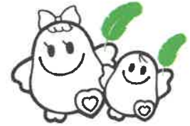
愛ちゃんと希望くん

昨年の10月1日から12月31日まで実施しました「赤い羽根共同募金」「歳末たすけあい募金」に多くの皆様からご協力をいただきありがとうございました。 皆様からお寄せいただいた募金の使いみちについてお知らせいたします。 今後とも皆様の温かいご支援とご協力をお願いいたします。